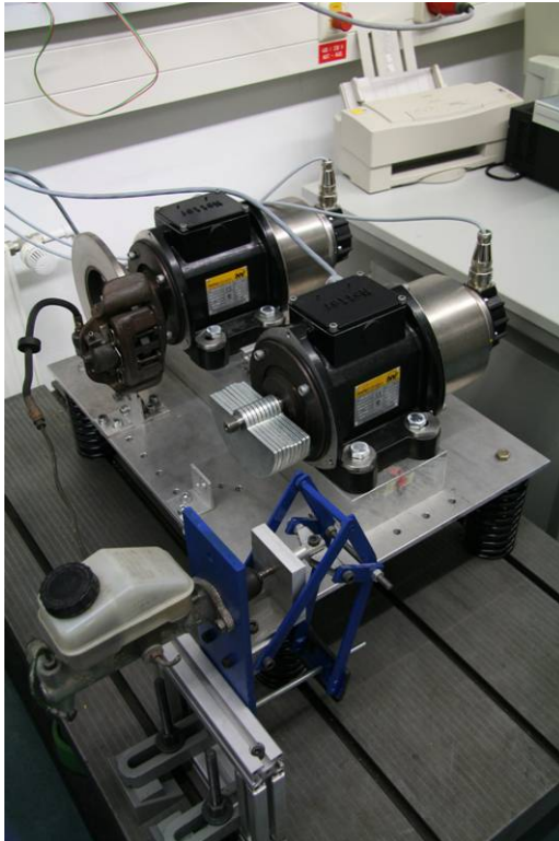
Bild 2: Versuchsstand des elektronischen Synchronisationsgetriebes, ausgestellt auf der BAUMA '07